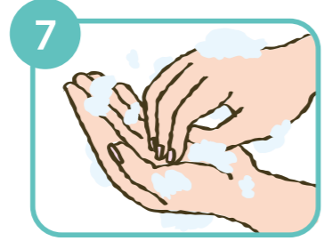
7 指先をもう片方の手のひらでもみ洗う。