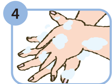
4 手の甲をもう片方の手のひらでもみ洗う。