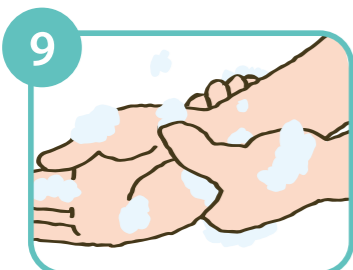
9 両手首まで洗いぬいにもみ洗う。