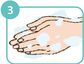
3 手のひら同士をすり合わせよく泡立てる。