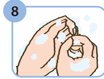
8 必要な場合は爪ブラシを使って指先をもみ洗う。