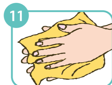
11 ペーパータオルでよく水気をふき取る。