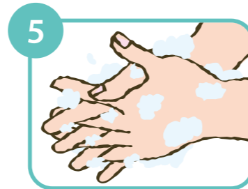
5 指を組んで両手の指の間をもみ洗う。