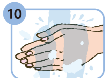
10 流水でよくすすぐ。