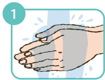
1 手指を流水で濡らす。